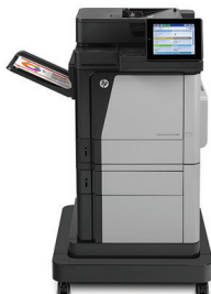
Urządzenie wielofunkcyjne HP Color LaserJet Enterprise M680f