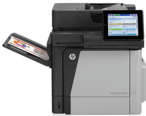
Urządzenie wielofunkcyjne HP Color LaserJet Enterprise M680dn

Wydajne, kolorowe urządzenie wielofunkcyjne obsługujące zadania wielkonakładowe. Funkcje drukowania i kopiowania oraz skanowania i faksowania 1 . Zaawansowane funkcje skanowania i kolorowy ekran dotykowy o przekątnej 20 cm (8 cali) gwarantują płynną pracę. Opcje drukowania mobilnego pomagają pozostać produktywnym w podróży 2 .