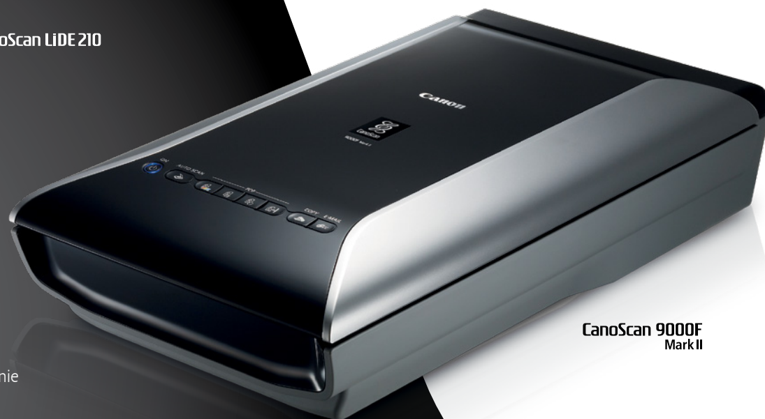
CanoScan 9000F Mark II

Zasilanie i przesyłanie danych do skanerów serii CanoScan LiDE za pomocą jednego kabla USB to oszczędność miejsca i brak konieczności podłączania dodatkowych przewodów. Stojak, dzięki któremu urządzenie można ustawić w pozycji pionowej (dotyczy wyłącznie modeli LiDE 210/700F) sprawia, że ten elegancki skaner zajmuje jeszcze mniej miejsca.