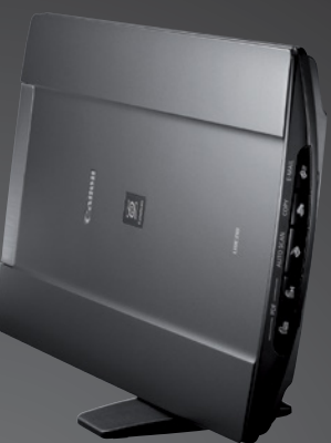
CanoScan LiDE 210

Skanery serii CanoScan — zaawansowane funkcje zarządzania obrazami i dokumentami. Wyraźne i bardzo dokładne skany, funkcje ułatwiające obsługę skanowania zdjęć, dokumentów i klisz to zalety, dzięki którym te eleganckie skanery formatu A4 o niewielkich rozmiarach doskonale się nadają do domowego biura.