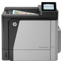
Drukarka HP Color LaserJet Enterprise M651dn

Wydajność, na której można polegać: niezawodne drukowanie profesjonalnej jakości dokumentów kolorowych w dużych nakładach. Wydajne opcje szybkiego drukowania i drukowania mobilnego oraz łatwe zarządzanie pomagają zapewnić produktywność w dowolnym miejscu.