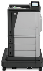
Drukarka HP Color LaserJet Enterprise M651xh