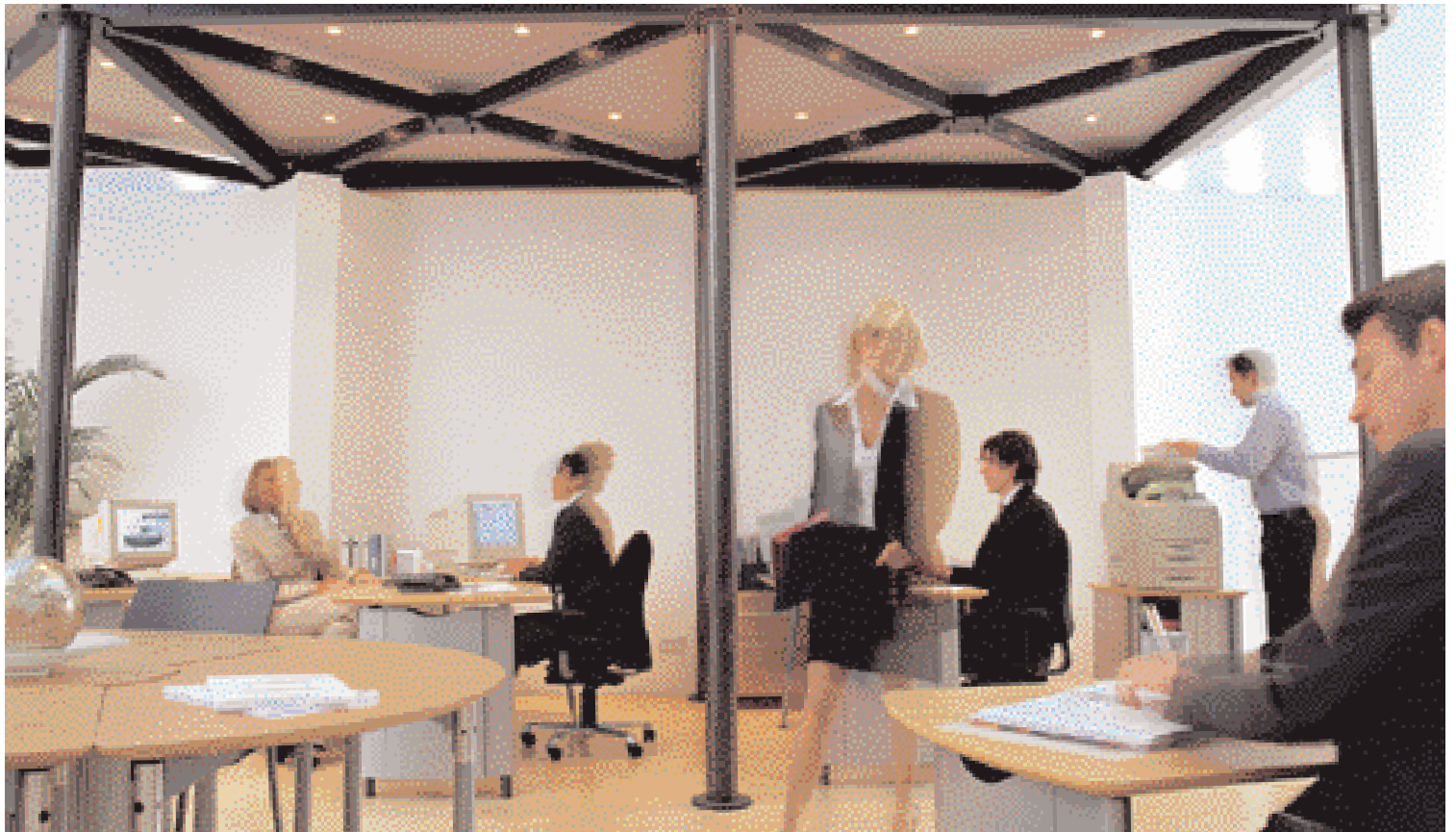
B6300n: Wysoce wydajny druk dla profesjonalistów w grupach roboczych

Wszystkie nasze drukarki wyróżniają się znakomitą efektywnością w miejscu pracy. Wybierz swoją drukarkę i jej szczególne właściwości bazujące na specyficznych wymaganiach twojej firmy.