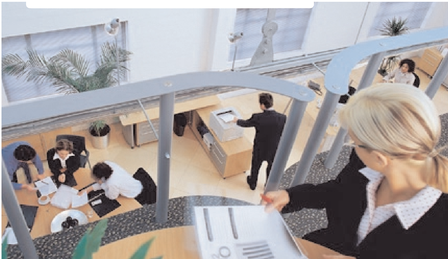
B6200: Profesjonalny druk dla małych grup roboczych

Drukowanie monochromatyczne jest podstawą nie zakłóconego działania przedsiębiorstwa. Podstawowe warunki wstępne, które muszą zostać spełnione, to trwałość i długi czas nieprzerwanej pracy. Historycznie, nabywca wybierający drukarkę musiał wybrać pomiędzy korzyściami indywidualnymi, takimi jak najwyższa jakość wydruku, największa pamięć, najszybszy wydruk pierwszej strony lub maksymalna ilość stron na minutę.