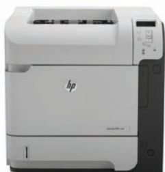
HP LaserJet Enterprise 600 M601dn