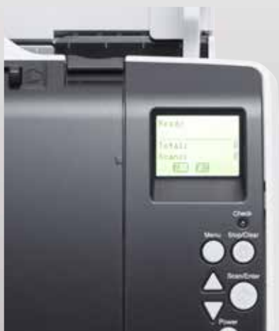
Panel sterowania z wbudowanym podświetleniem wyświetlacza LCD

Podświetlany wyświetlacz LCD na panelu sterowania daje błyskawiczny dostęp do ustawień skanera, stanu pracy i licznika arkuszy. Dodatkowym ułatwieniem jest możliwość uruchamiania za pomocą panelu użytkownika wstępnie zdefiniowanych procedur skanowania utworzonych przy pomocy doskonałej funkcji PaperStream Capture.