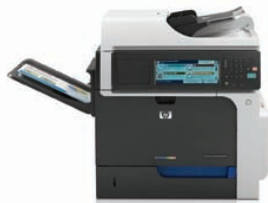
Urządzenie wielofunkcyjne HP Color LaserJet Enterprise CM4540