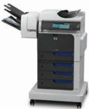
Urządzenie wielofunkcyjne HP Color LaserJet Enterprise CM4540fsk