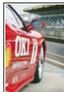
Kartki pocztowe A6