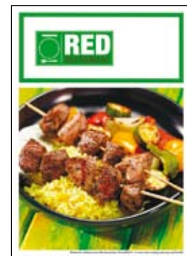
Dwustronnie drukowane menu A4