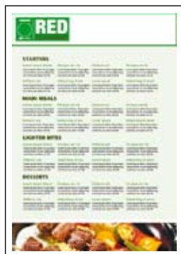
Banery o wymiarach maksymalnych 215 x 1200 mm