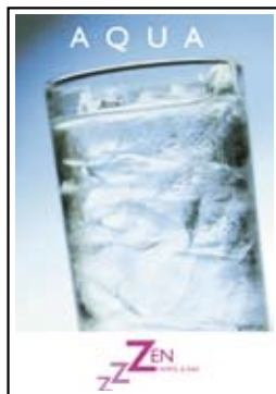
Kartki pocztowe A4