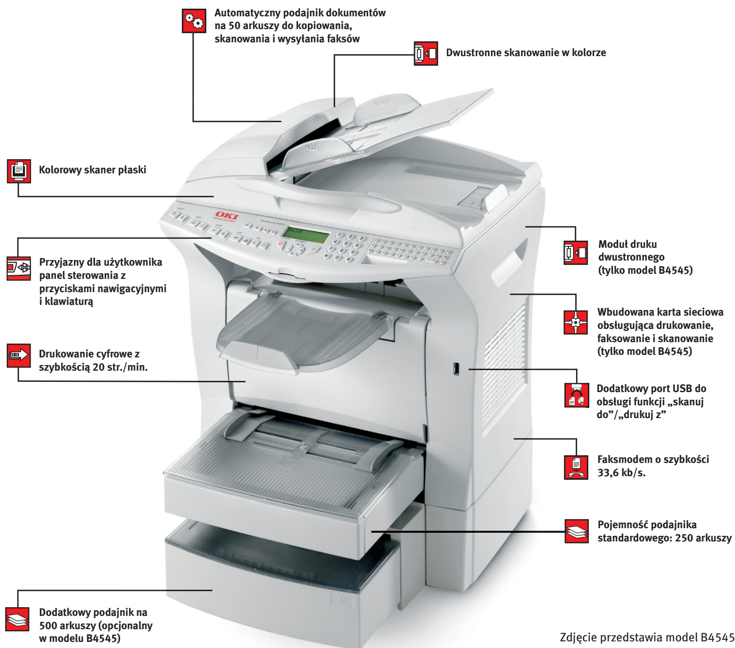
Zdjęcie przedstawia model B4545