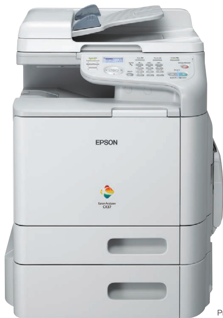
Prezentowany model: CX37DTNF

Urządzenia Epson AcuLaser z serii CX37DN umożliwiają średnim i dużym grupom roboczym dwustronne drukowanie w formacie A4 oraz kopiowanie i skanowanie monochromatyczne i w kolorze. Modele CX37DNF i CX37DTNF wyposażono też w funkcję faksu. Urządzenia z tej serii posiadają w standardzie automatyczny podajnik dokumentów, a opcjonalna dodatkowa taca na papier pozwala grupom roboczym poprawić wydajność oraz oszczędzić czas, prosto i szybko zwiększając pojemność papieru.