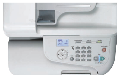
Proste i łatwo dostępne przyciski ułatwiają korzystanie z drukarek z serii AcuLaser CX37DN