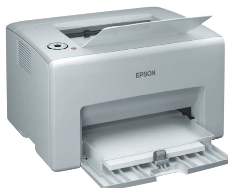
Drukarki z serii AcuLaser C1700 zajmują tyle miejsca, co drukarki biurkowe