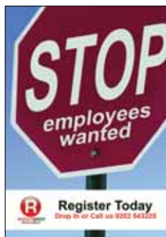
Kartki pocztowe A4