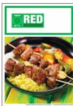
Dwustronnie drukowane menu A4