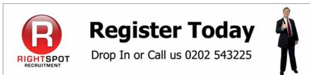
Banery o wymiarach maksymalnych 215 x 1200 mm