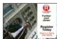
Kartki pocztowe A6