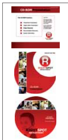
Rozwiązania na płyty CD