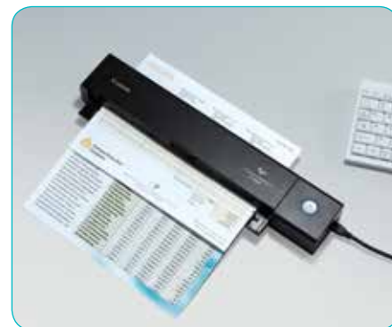
Podajnik dokumentów na 10 arkuszy z funkcją skanowania dwustronnego

Urządzenie P-208II przyda się również w domu, ponieważ doskonale nadaje się do skanowania rachunków, a tryb obrazu umożliwia niezwykle precyzyjne skanowanie starych zdjęć.