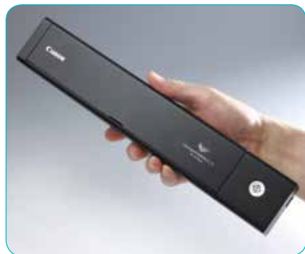
Wyjątkowo cienki i lekki