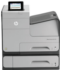
Drukarka kolorowa HP Officejet Enterprise X555xh