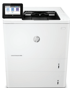
Drukarka HP LaserJet Enterprise M609x