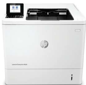
Drukarka HP LaserJet Enterprise M609dn

Drukarka HP LaserJet z technologią JetIntelligence łączy w sobie wyjątkową wydajność i energooszczędność z możliwością drukowania profesjonalnej jakości dokumentów dokładnie wtedy, kiedy są potrzebne – a jednocześnie chroni sieć przed atakami dzięki najmocniejszym zabezpieczeniom od HP 1 .