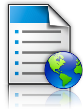
Formularze i ulubione

Możliwości rozwiązań zastosowanych w tej serii urządzeń w połączeniu z narzędziami Lexmarka do zarządzania flotą, posiadanym w firmie oprogramowaniem oraz infrastrukturą techniczną tworzą inteligentny ekosystem urządzeń wielofunkcyjnych Lexmarka. Elastyczność rozwiązania sprawia, że inwestycja w technologie Lexmarka będzie procentować przez wiele lat.