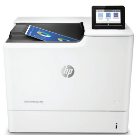
HP Color LaserJet Enterprise M653dn

Drukarka HP Colour LaserJet z technologią JetIntelligence łączy w sobie wyjątkową wydajność i energooszczędność z możliwością drukowania profesjonalnej jakości dokumentów dokładnie wtedy, kiedy są potrzebne – a jednocześnie chroni sieć dzięki najmocniejszym zabezpieczeniom od HP 1 .