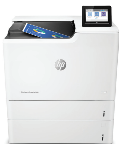
HP Color LaserJet Enterprise M653x