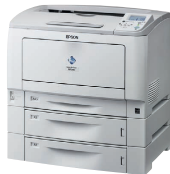
Model AL-M7000D2TN z modulem dwustronnym i z dodatkowymi tacami na papier w standardzie