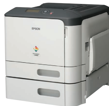
Opcjonalny, dodatkowy podajnik na 500 arkuszy zwiększa pojemność papieru do 850 arkuszy.